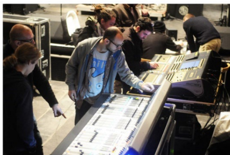
Formation professionnelle Son Lumière Plateau - Session 2016-2017