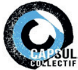
TÉMOIN Arnaud Fièvre coordinateur du Collectif Capsul

L'insertion professionnelle durable des artistes musicien-ne-s n'est-elle pas l'affaire de l'ensemble des acteurs et des actrices de la filière ?