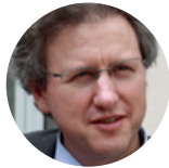
TÉMOIN Philippe Ribour inspecteur de la création artistique - Collège musique à la Direction Générale de la Création Artistique (DGCA) - Ministère de la Culture