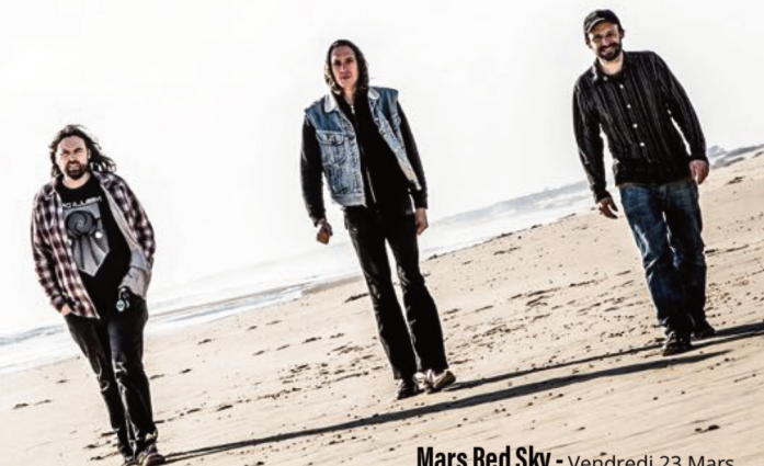
Mars Red Sky - Vendredi 23 Mars