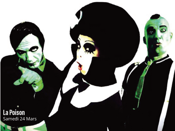
La Poison Samedi 24 Mars